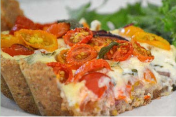
Tarta de tomates