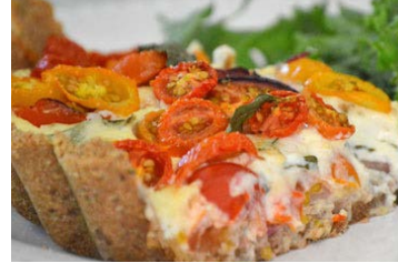
Tarta de tomates